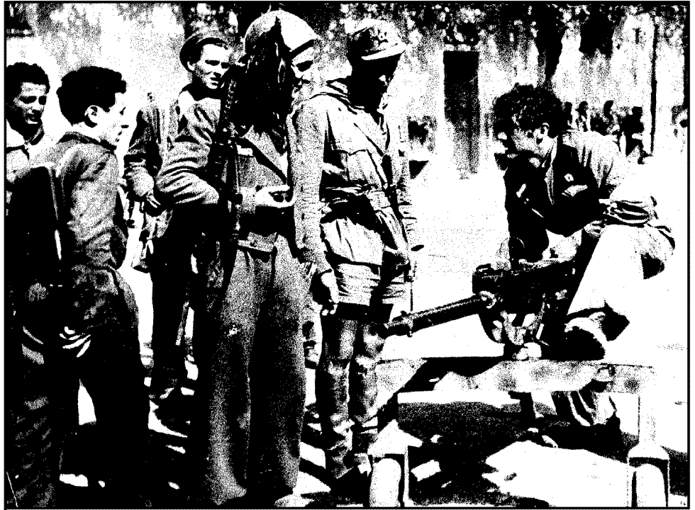
RESISTENZA Un gruppo di partigiani prepara le armi per un'azione militare nella zona di Alba, in Piemonte, nell'autunno del 1944

Per la legge è un atto di guerra, da archiviare. Per l'orfana un'ingiustizia da punire